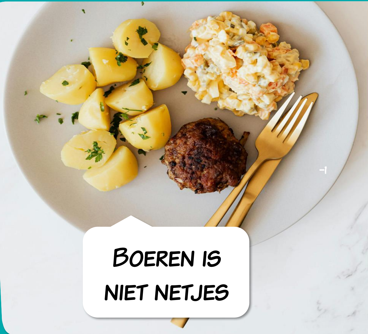
BOEREN IS NIET NETJES