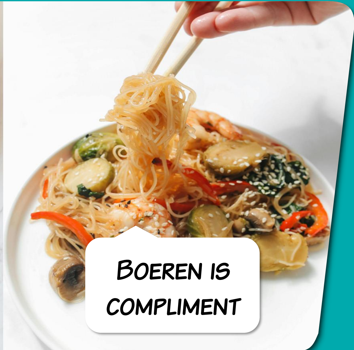
BOEREN IS COMPLIMENT