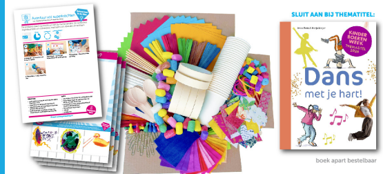
impressie leshandleiding, werkbladen en ontwerpmaterialen

Licht uit, spot aan! Met de ontwerpbox bij het boek Dans met je hart! van Imke Brok en Marja Meijer leren de kinderen over zes soorten dans: klassiek ballet, modern ballet, jazz, streetdance, breakdance en hiphop. Ze ontdekken wat spotten is en dat dansen goed is voor je brein. Toi-toi-toi!