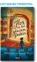
boek apart bestelbaar

Voor meer informatie kun je terecht bij els@ontwerpenindeklas.nl of www.ontwerpenindeklas.nl/ontwerpbox