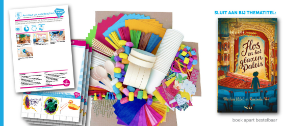
impressie leshandleiding, werkbladen en ontwerpmaterialen