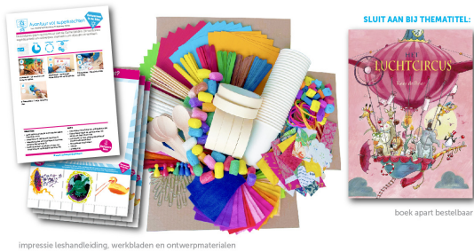
impressie leshandleiding, werkbladen en ontwerpmaterialen

Prijs per ontwerpbox compleet en ontwerpbox compact is resp. €45,95 / €29,95 incl. BTW en verzending binnen Nederland. Bij bestelling vanaf acht boxen profiteer je van de staffelprijs van resp. €41,95 / €25,95 per ontwerpbox. Bestel je uiterlijk 31 mei 2026, dan krijg je 5% vroegboekorting op ontwerpboxen!