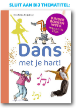
boek apart bestelbaar