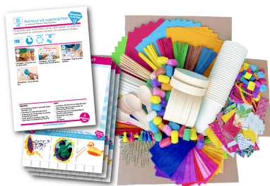
impressie leshandleiding, werkbladen en ontwerpmaterialen