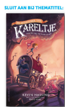
boek apart bestelbaar